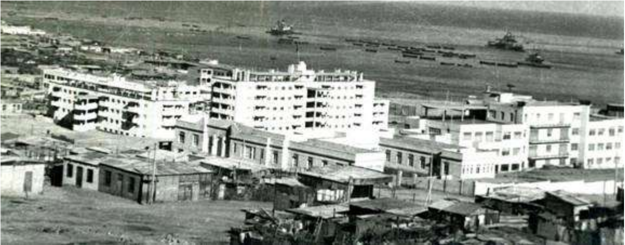
Foto del Puerto de Tocopilla