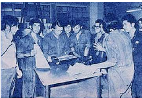
Trabajadores de la Editorial Quimantú

Padre Jehova; en las imprentas de este mundo, no hacen los trabajos gratis; Así es Hijito; así es la explotación; sé que ni mencionando el nombre del Padre, estos demonios dejan de cobrar; en la editorial Quimantú, el llamado gerente general, no me dió importancia; ni el personal conque tratastes; vieron las pruebas; viajastes con mucho sufrimiento, para darles a conocer la más grande